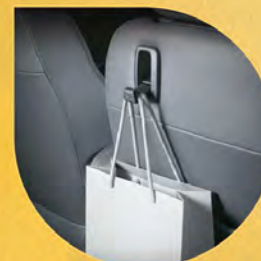
前乘客座椅椅背掛勾