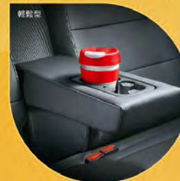
後座中扶手附雙置杯座