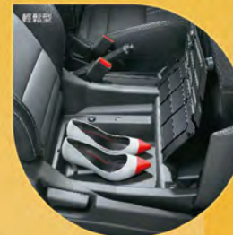
前乘客座椅前翻置物