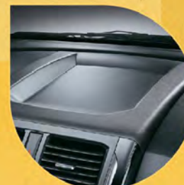
中控台上方置物空間