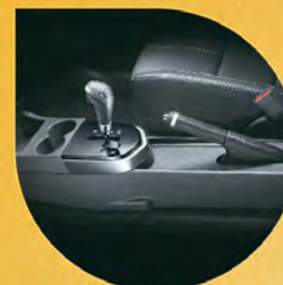
整合式中央置物盒 (零錢盒 / 置杯架 / 置物盒)