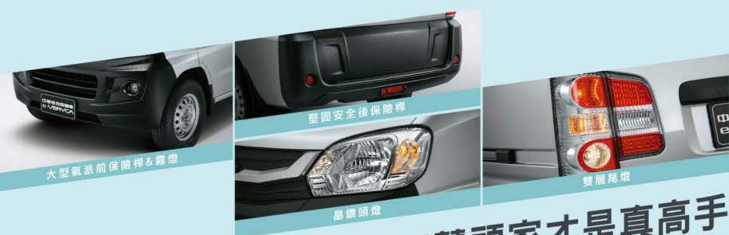
大型氣派前保險桿&霧燈