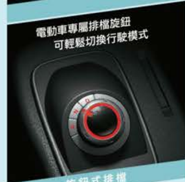
電動車專屬排檔旋鈕 可輕鬆切換行駛模式