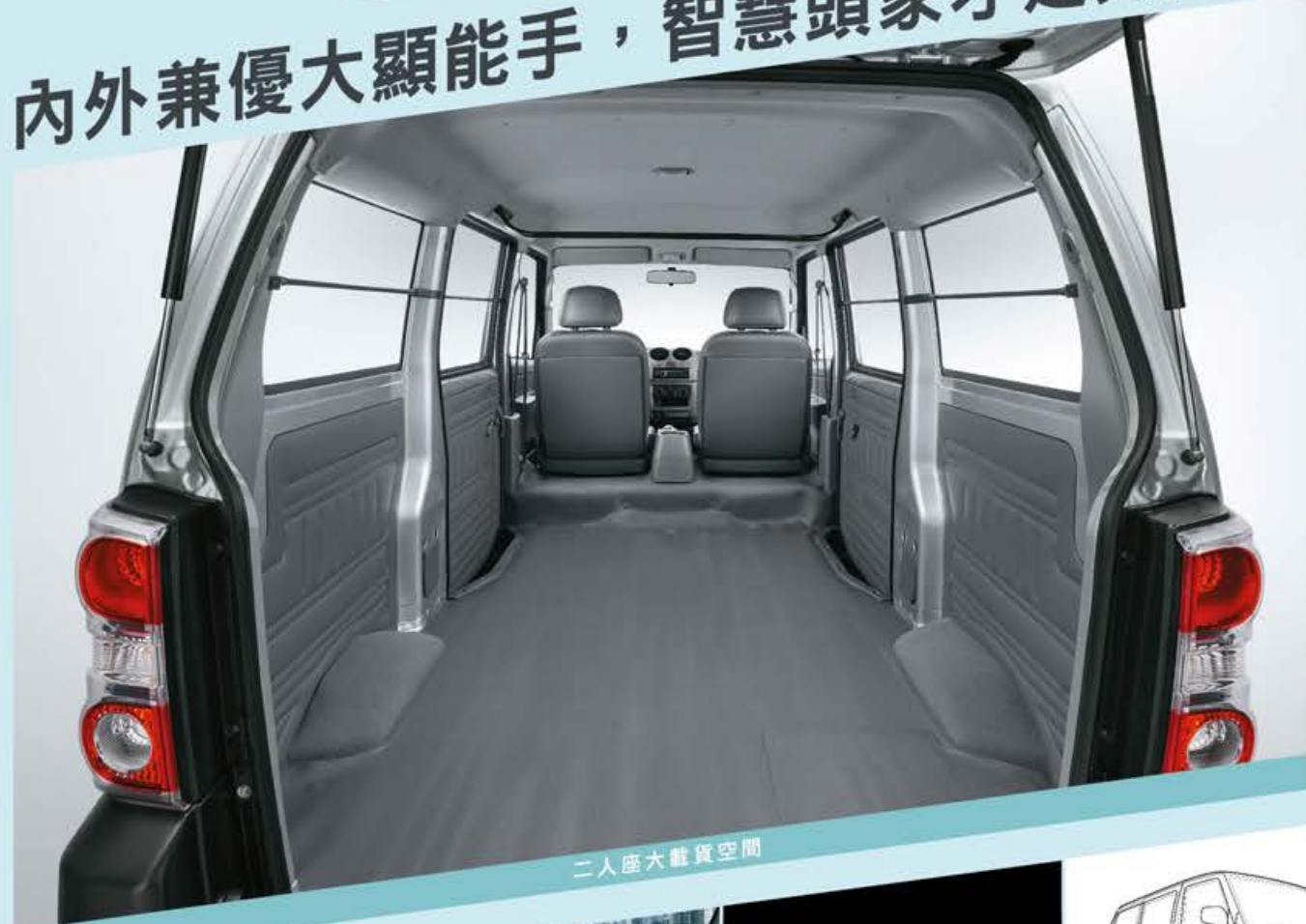
二人座大載貨空間