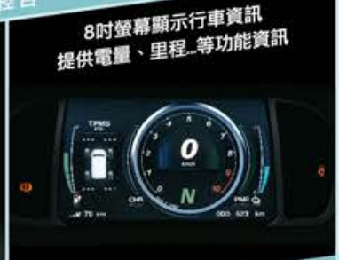
8吋螢幕顯示行車資訊 提供電量、里程...等功能資訊