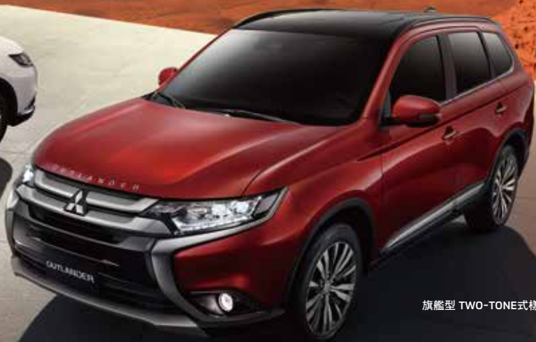
旗艦型 TWO-TONE 式樣

OUTLANDER引擎蓋銘板及大型擾流尾翼為經銷商標準選配(各車型配備等級不同, 詳如規格配備表) TWO-TONE式樣: 包含曜黑車頂與內裝黑頂篷(限尊貴型/旗艦型)亮光紅與冰曜白車色加價選配