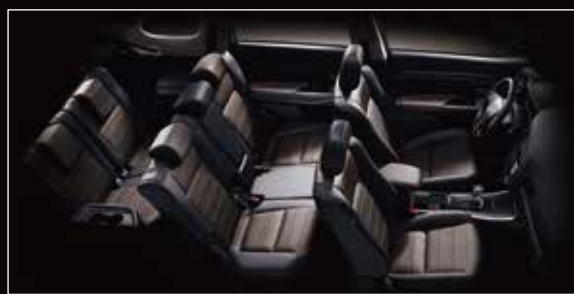
七人座彈性靈活空間 (尊貴型七人座)