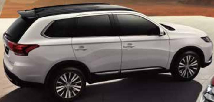
尊貴型 TWO-TONE 式樣