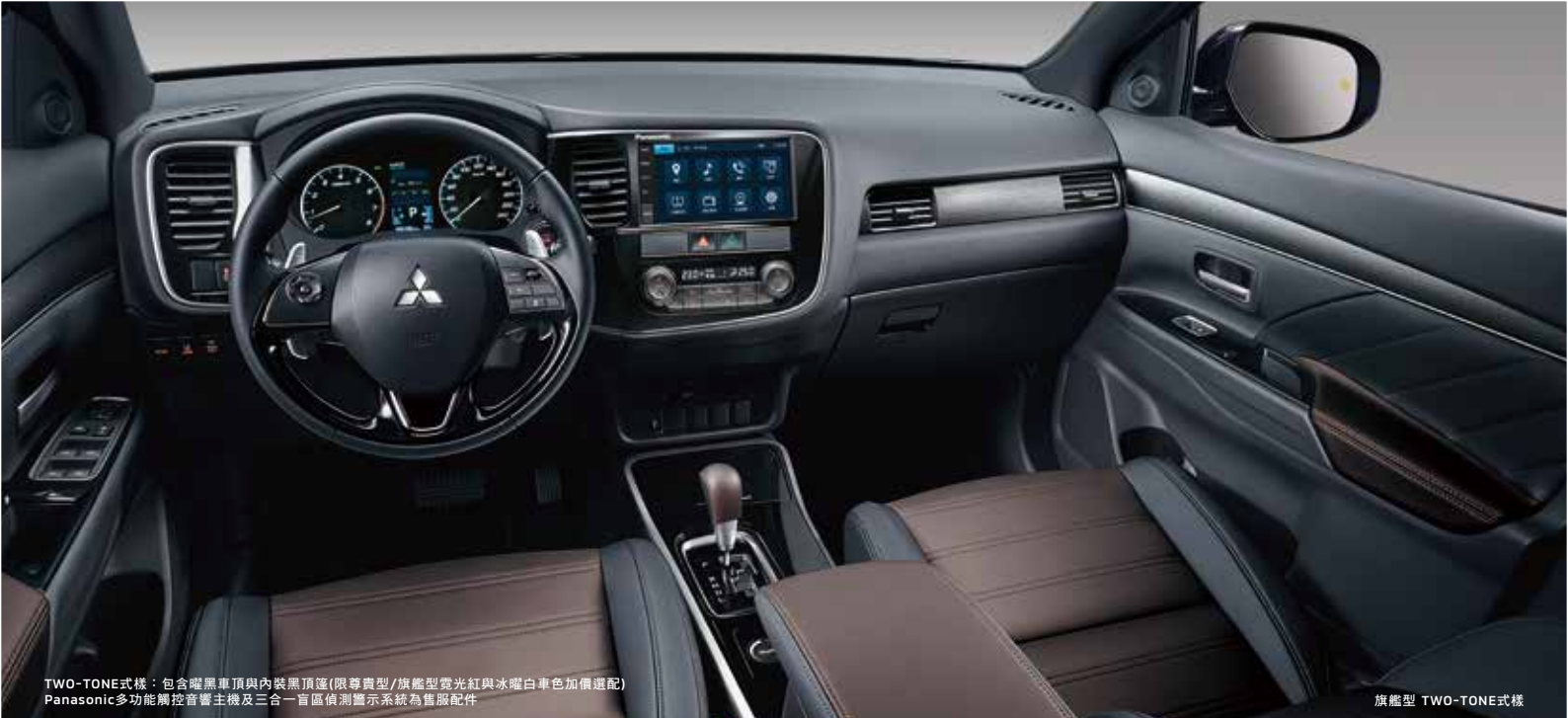
TWO-TONE式樣：包含曜黑車頂與內裝黑頂篷(限尊貴型/旗艦型)或光紅與冰曜白車色(加價選配) Panasonic多功能觸控音響主機及三合一盲區偵測警示系統為選廠配件