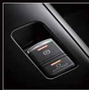
Electric Parking Brake(EPB) 電子式駐煞車附Auto Hold功能