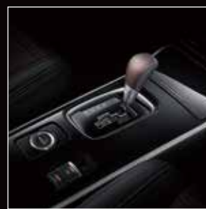
大型化中央整合控制台